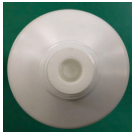
変更後：逆流防止弁付き